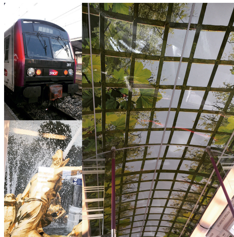
Photos de Pavel @pa_083 12 juil. Trop belle, la nouvelle déco @Versailles sur le #RERC !